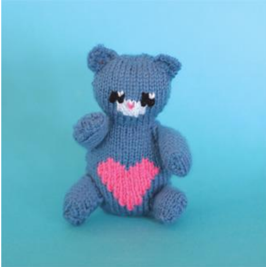
Gebreid Valentijns beertje