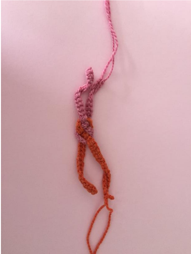
Naai de 2 uiteinden vast per kleur. Maak aan 1 kant een knoop vast.